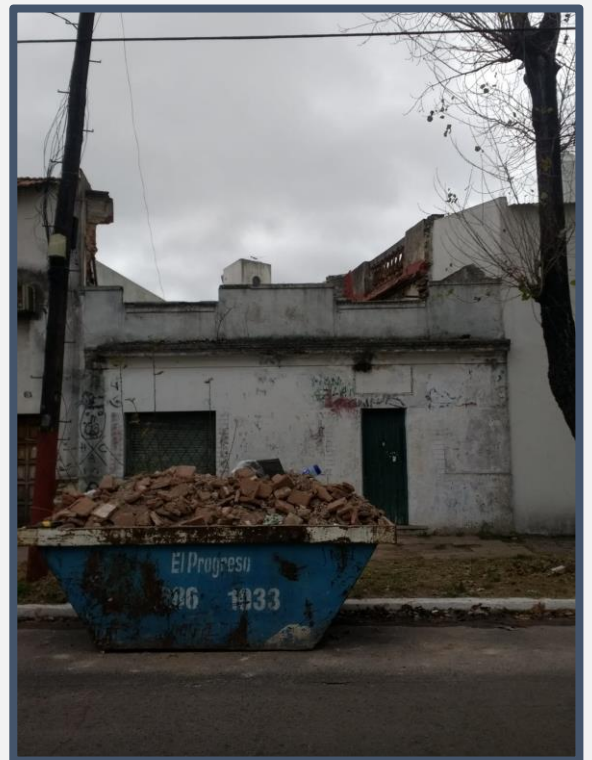
Imagen 2: Vista de los restos de la torre mirador del siglo XIX, Chacra de A. Lanús, dentro de volquete.